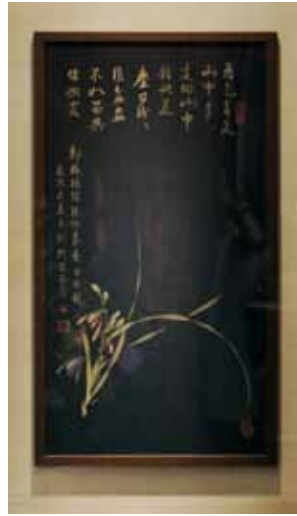
鄭板橋 詩 / 甘侯 題字

鄭板橋(1693~1765)，清代書畫家、文學家。名燮，字克柔，號板橋。江蘇興化人。能詩文，詩近香山、放翁，他的《悍吏》、《私刑惡》、《孤兒行》、《逃荒行》等作品，描寫民間疾苦頗為深切。著有《板橋全集》。