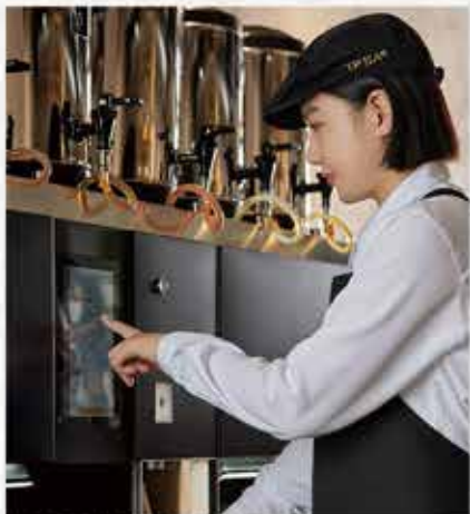
未來概念店導入智能茶飲機