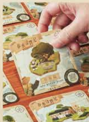
春水尋寶記 - 限定杯墊

呼應主題【春水尋寶記】，本次視覺設定為「航海冒險」，將五千年中國飲茶歷史延伸出六座島嶼：採茶島、煮茶島、點茶島、壺泡島、蓋碗島、調茶島，島嶼環狀排列後的中心點就是大秘寶「茶葉」。背景以世界地圖呈現，象徵茶葉的影響力擴及全世界，而調茶島是最先進的島嶼，島上的春水堂是「世界珍珠奶茶發源地」，島上的居民透過推廣新型態的飲茶方式，將茶文化拓展至全球。