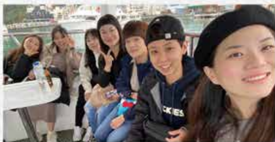
一起坐船遊湖日月潭

接著我們享用了秋山午宴的創意料理，每道菜都很用心很創新，每一口都是享受，雖然餐點的份量看起來不是很多，但是一道接著一道，吃的意猶未盡，秋山夥伴貼心的介紹餐點，讓我們感受到滿滿的專業與服務溫度，必須給他們讚讚。