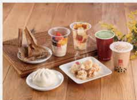
方便外帶的得來速品項

藤澤店，是日本最大面積門店，共有 76 席位，設有 28 個停車位。入口以日本枯山水風格，