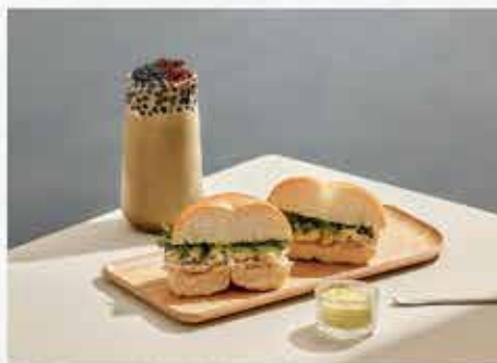
單店限定 | 焙茶咖啡凍、輕食貝果系列

「茶湯會」今年 19 歲了，創立至今一直專注於茶的專業，穩定品質、嚴選物料以及創新活動；台灣分店迄今穩定發展，於 2015 年將觸角延伸至海外，但受 COVID-19 疫情影響，海外展店速度趨緩，我們沒有浪費這個沈澱時期，反而投入更多的心力去思考品牌提升的方式。