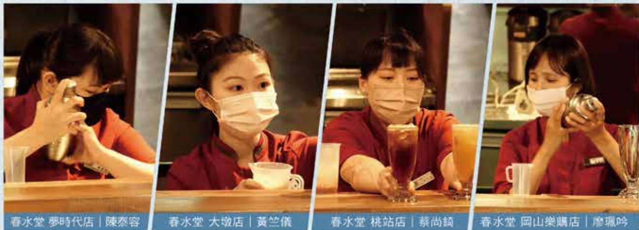
春水堂 夢時代店 | 陳泰容