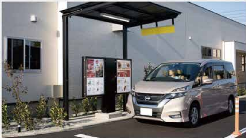
第一間 Drive Thru 得來速的春水堂

原味的在藤澤店限定開賣！此外，香酥雞、水煎包、鳳梨蝦球等等，也是藤澤店的限定品項。而令人好奇的得來速，除了飲品以外，也有幾樣簡單的輕食，如豆花、肉包等。不論是內用還是外帶，無一不滿足在日台灣人的思鄉情懷。