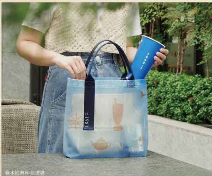
春水經典印花提袋

活動方面，以六個飲茶時期設計問答遊戲，以題目互動讓茶友在答題的過程中，輕鬆無壓力的探索且理解茶葉的五千年歷史，也感謝 3 千多位的茶友一起參與。在春水堂現場，我們規劃以六座茶島嶼為主題的限定杯墊，透過生動的插畫，誘發茶友的求知慾，掃描 QR code 進入春水堂官網探索更多的茶知識。