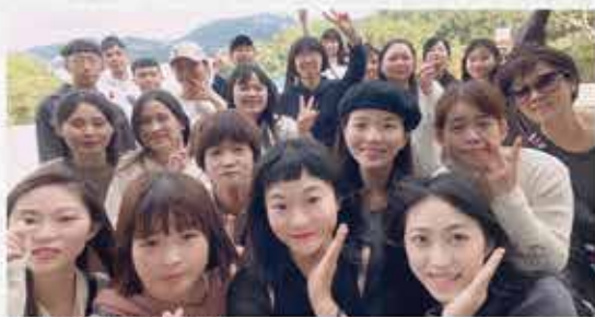
認識了不同分店的夥伴

雖然第一天的行程天氣不佳，下著毛毛細雨，但並沒有澆熄我們享用秋山午宴的歡樂氣氛，在會館導覽人員耐心的帶領下，從環境、植栽介紹到整個會館的導覽都令人深刻感受執行長經營的用心，會館內有好多特別的松樹、楊桃樹、老桂花樹…等等植栽，讓我印象最深刻的是曲水流觴，環境優美、營造出很適合泡茶交流的氛圍。