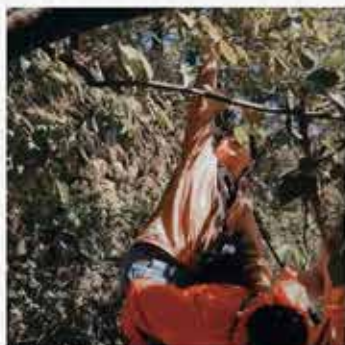
採摘秋山居的果實

回程的車上大家輕鬆交談，在這兩天一夜裡，我們享受了每個美好瞬間。非常感謝執行長安排了這樣的旅行，讓南北中部的夥伴們在這個充實又難忘的經歷中彼此更加了解，也加深了情感聯繫，也撫平了平日工作的疲累，讓這次的員工旅遊留下滿是歡笑的美好記憶。📍