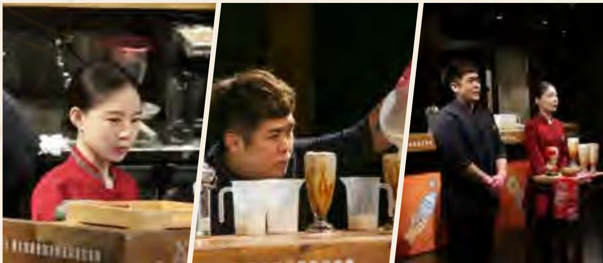
春水堂 和平文化店 | 吳翠璋

期盼三年沒有舉辦的品鑑會終於回歸了，這次是創意茶比賽。雖然看似簡單無限制，但各店都需要絞盡腦汁發揮天馬行空的創意。品鑑會對於我來說不會過於陌生，但又有些距離感。原因是，自從加入春水家族之後，當時帶領我的店長常宣導我們，希望大家有機會都能去參加，就算不是上場，至少能夠去現場觀摩比賽。