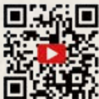
資深鐵粉真情告白

「好想聽聽資深鐵粉的故事喔」，因為這個想法開啟了訪問鐵粉的企劃，感謝各分店店長提供鐵粉的資訊，在一番嚴格的討論之後，總共票選出了 11 位鐵粉，分兩種方式的採訪，5 組鐵粉為文字訪問刊登在 40 周年特刊中、6 組鐵粉用影像紀錄，用影像及聲音表述對春水堂的愛，影片放置在 Youtube 及 Facebook 影音中。