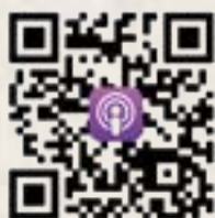
歡迎收聽『茗間流傳』 春水堂唯一 Podcast

鐵粉們闖關的精采故事真的無法用文字表達，如何集點的大補帖以及闖關過程的心路歷程通通都收錄在 Podcast 節目「茗間流傳」上，請大家搜尋收聽，保證讓你為之驚艷！