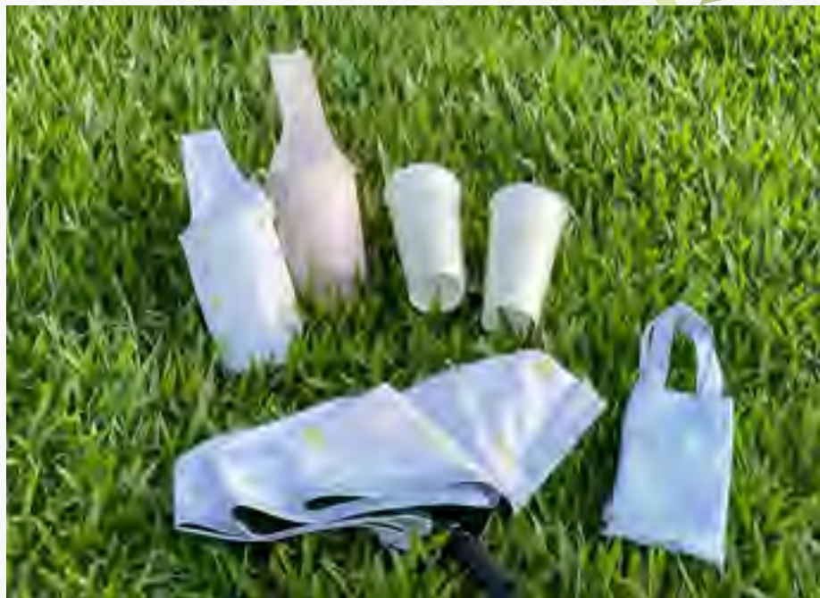
▲（左上）大振豐洋傘製「抗 UV 自動摺疊傘」 / （左下）「18 周年限定杯」與「茶湯同樂杯」 / （右）18 周年限定全系列周邊。