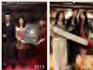
▲第一屆春水廳后得主，再次成功完成第三屆春水廳城鐵粉挑戰賽。

在頒獎典禮上，有第一屆的廳后、遠赴日本參賽的廳帝、出奇招穿恐龍裝集點，甚至還有三屆都參加的一家人（第一屆兩人交往、第二屆生下大女兒、第三屆生下小女兒），每一組參賽者都有不同的集點撇步，集點過程當中也創造出許多故事，而每一段故事其實都圍繞在對於春水堂的愛。這一次頒獎典禮還有一個亮點，特別安排珍珠奶茶手搖體驗，鐵粉們都是第一次參加這樣的活動。過程中，不僅可以更加理解當初發明珍奶的故事，也可以用雪克器搖出屬於自己的珍珠奶茶，鐵粉們直呼真的太有意義了！