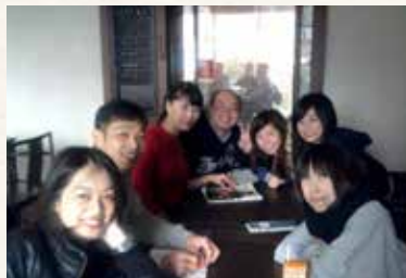
▲ 與春水堂夥伴們一同合影