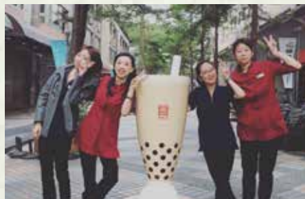
▲ 與春水堂夥伴們一同合影、留念

近幾年因家庭因素轉調至後勤單位 - 資訊部，工作內容為專案導入、協助門店處理Pos機及網路相關問題，然而轉換跑道是個大挑戰，好在過去累積許多營業店的經驗和工作態度，讓我更能快速地融入新的工作。雖然無法在營業店服務，但仍熱愛春水文化，很開心可以用另一種身分持續當我喜愛的那個春水人。