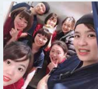
▲ 與春水堂夥伴們一同合影、留念