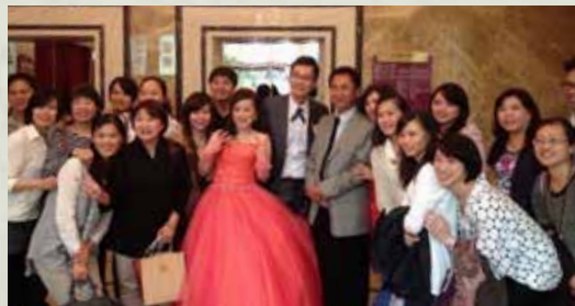
▲ 執行長全家福，及上級滿滿的祝福