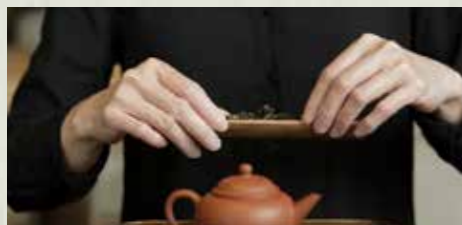
▲ 喜歡泡茶，友人拍下這個當下