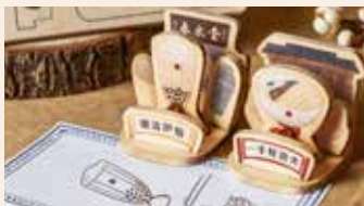
▲ 生日慶限定商品 - 印章明信片

從『陽羨茶行』展開序曲，以小壺泡起家，結合西式調酒吧台，首創以雪克器注入茶泡並將傳統熱飲壺泡冷飲化，搖出第一杯冷飲「泡沫紅茶」，此舉為茶文化的開創新時代革命，成為傳統熱飲壺泡冷飲化的創意茶文化推手，讓冷飲也能品茗厚實底蘊的功夫茶，從此成功開拓冷飲茶新潮流。