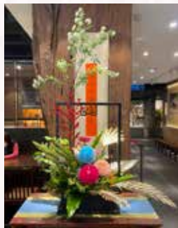
▲ 店內佈置作品之一