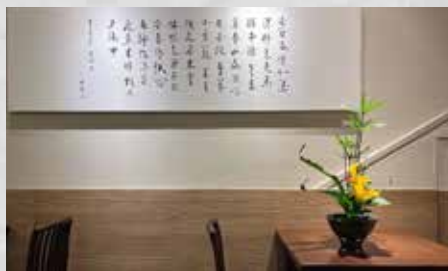
▲親手創作春水堂 - 新時代店內之插花作品

丹菊的豔麗，在花瓣上的水滴讓花顯得嬌嫩，像個可人又嬌羞的女子看著水的倒影，當下無法形容心中的喜悅和成就感，彷彿這是我人生中最棒的嘗試。就這樣，誤打誤撞地打開插花之路的大門，看著書上以及網路上的教學，一次又一次地激起想要創作的慾望，於是，作品就一個個誕生，不過，我還是沒上過正式的花藝課。