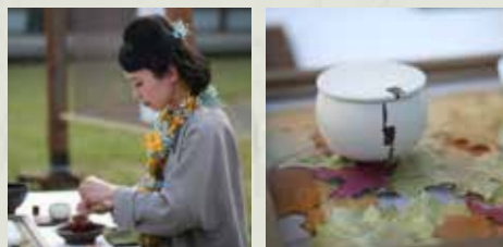
▲ 經歷過無數次的練習，將自己所學，以表演的方式在全方位競賽中呈現