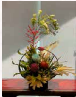
▲ 店內佈置作品之二