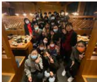
▲ 與春水堂夥伴們一同合影

春水家人給的愛如同家人般似的，每次犯錯時，總是帶著溫暖給予教導，每天做一樣的事情，而每天的心情卻是不一樣，相處的這段日子讓彼此的距離縮短了，我想告訴我的春水家人們，你們給予我正能量的愛，讓我對於每次的犯錯都能自我轉換心態去調整與面對，謝謝你們幫我的生活又添加了更多有趣的事蹟。