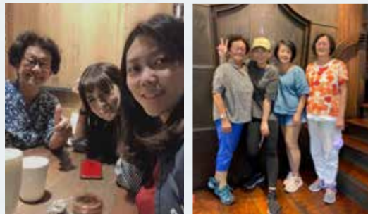
▲ 與陳阿姨一同合照紀念