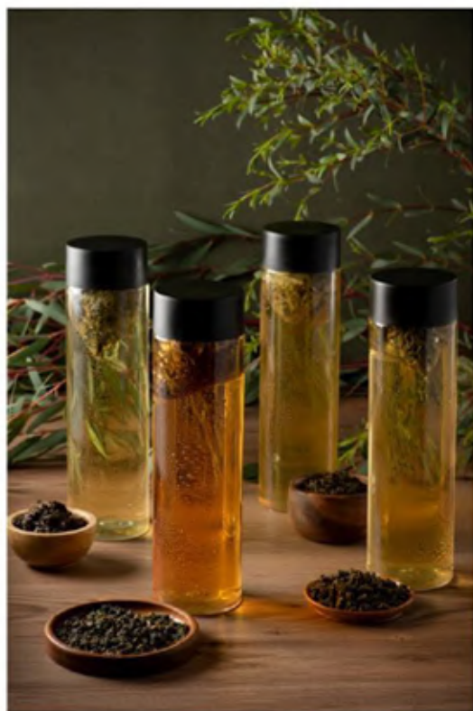
▲ 香港限定的台灣冷泡原葉茶。