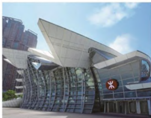
▲ 香港西九龍站外觀。