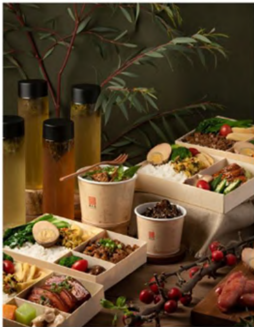
▲ 台式方味特製便當與經典美味的台式滷味。

香港首家店並無設置內用座位區，是一個專為過往旅客提供外帶需求的專門店，雖然無內用座位區，但是仍為旅客提供餐食上的需求。有機會來香港旅遊，也能夠品嚐到春水堂熟悉的幸福滋味，歡迎大家到香港春水堂來喝杯茶。