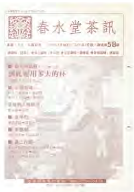
初代春水堂茶訊曾經因應不同的溝通對象與功能性而有多種樣貌版本。

我們的進步，有賴各位讀者的參與，希望您能在與我們成長的道途上，繼續給予批評與指教。