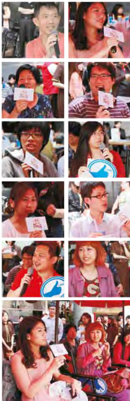
今年特別邀請了10位2013年度春水蘿帝后來擔任春水堂的人氣陪審團，希望讓原本只屬於春水堂內部的調茶比賽被更多人看見，讓更多茶友們了解春水堂一絲不苟的服務態度、調茶精神及歷史文化。